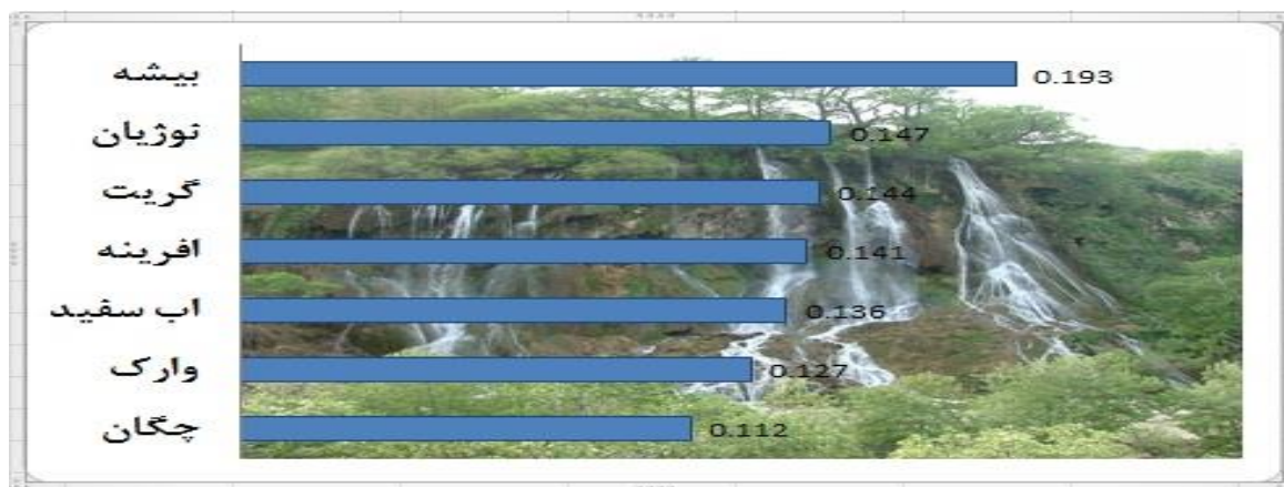
شکل ۲. اولویت‌های آبخازهای هفت گانه استان لرستان