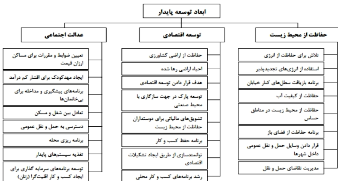
شکل ۱. ابعاد توسعه پایدار

کس ۷ معتقد است توسعه پایدار روندی است که بهبود شرایط اقتصادی، اجتماعی، فرهنگی و فن‌آوری به سوی عدالت اجتماعی را دنبال می‌کند و در جهت جلوگیری از آلودگی اکوسیستم و تخریب منابع طبیعی گام برمی‌دارد (تقوایی و صفربادی، ۱۳۹۲: ۶). ترنر ۸ نیز بر این باور است که توسعه پایدار شهری می‌کوشد تا