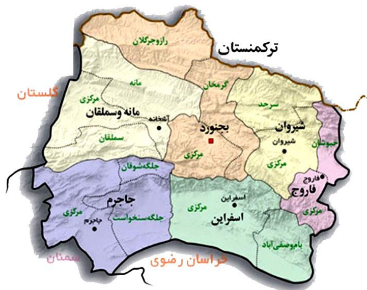
شکل ۳. موقعیت شهر بجنورد

جمعیت: به استناد نتایج سرشماری سال ۱۳۹۵، جمعیت شهر بجنورد ۲۲۸۹۳۱ نفر می‌باشد (مرکز آمار ایران، ۱۳۹۵).