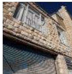
شکل ۷. ساخت رخیام با استفاده سنگ تخته‌ای در خانه‌های بومی پاره

داده شده و روی آن خاک و یک لایه رس قرار می‌گیرد (شکل ۸).