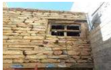
شکل ۸. ساخت رخیام با استفاده از تیرهای فرعی دیوار در خانه‌های بومی پاره

روی دیوار قرار می‌گیرد و دیوار طبقه دوم بر روی آن شروع می‌شود. ادامه تیرهای فرعی طبقه اول را هم برای جلوگیری از در رفتن و داشتن گیر بیشتر در سازه از نمای اصلی رد می‌کنند (شکل ۹).