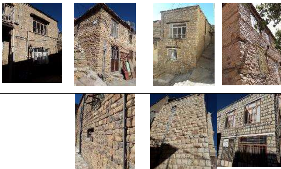
سنگ‌چین با ابعاد یکسان

دیوار است. چوب به صورت افقی در طول رجاها قرار می‌گیرد. انواع استفاده از چوب در دیوارها در جدول ۷، آورده شده است.