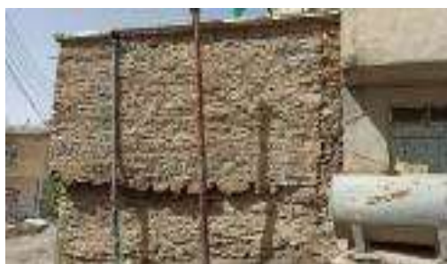
شکل ۹. ساخت رخیام در طبقات با استفاده از تیرهای فرعی در خانه‌های بومی پاره

۵. بازشوها: مصالح مورد استفاده در بازشوهای خانه‌های بومی پاره در جدول شماره ۱۰ ارائه شده است.