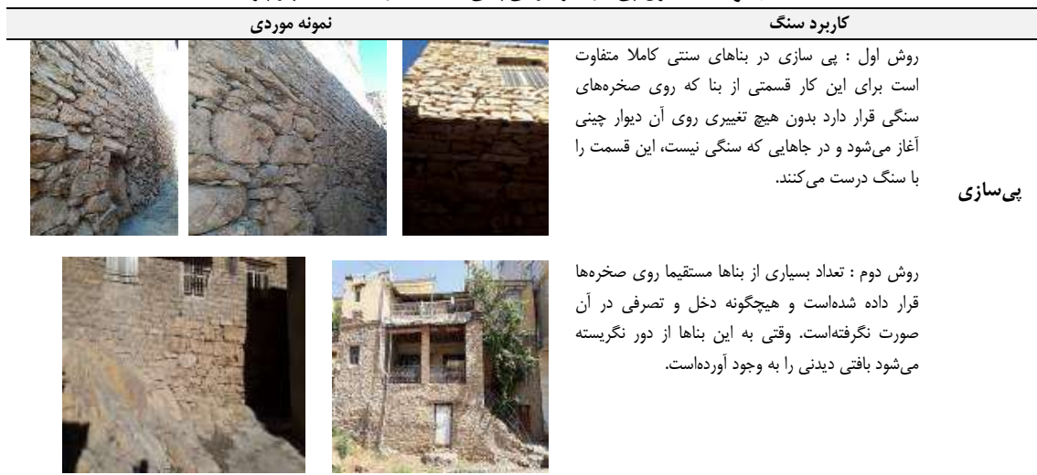
جدول ۵. اصول پی‌سازی و کرسی‌چینی با سنگ در خانه‌های شهر پاه

برای شناخت دقیق‌تر، مصالح و اصول ساخت‌وساز به تفکیک در پی و کرسی‌چینی، دیوار، سقف، رخیام و بازشوها مورد بررسی قرار می‌گیرد.