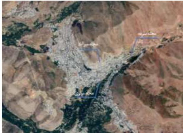
شکل ۳. موقعیت محله‌های سنتی مورد مطالعه پژوهش

اجتماعی در این شهر انجامیده است. برای سهولت بیشتر در خانه‌ها از فضاهای نیمه‌باز در این شهر به صورت کاملاً استادانه استفاده شده‌است. این فضاها به صورت پیش آمدگی یا عقب نشینی از نمای ساختمان حاصل شده‌است و توانسته پاسخ مناسبی به شیب زیاد بافت باشد. خانه‌ها اکثراً دو طبقه هستند به گونه‌ای که طبقه پایین محل نگهداری حیوانات و طبقه یا طبقات بالا فضای نشیمن را شامل می‌شود. قرارگیری طولیله (گه‌ور در زبان کردی) در طبقه پایین باعث گرم‌تر کردن کف طبقه بالای خود می‌شود.