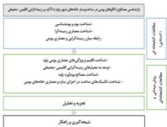
شکل ۱. فرآیند پژوهش

مطالعه حاضر پژوهشی کاربردی است که با روش توصیفی-تحلیلی و راهبرد نمونه موردی تدوین شده است. در ابتدا بخش نظری با رویکرد کیفی به بررسی ادبیات نظری موجود در حوزه بوم، معماری بومی و رابطه میان معماری بومی و زمینه‌گرایی پرداخته است. در ادامه بعد از یک بازدید میدانی از شهر پاوه، خانه‌های پلکانی و بومی سه محله سنتی میرآباد (هسته اولیه و قدیمی شهر)، سرده و میدان مولوی (شکل ۳) که تاکنون ساختار کلی خود را حفظ کرده‌اند، شناسایی و بر اساس فرمول کوکران حجم نمونه مشخص و ۵۰ نمونه خانه بومی از سه محله مذکور، به روش تصادفی انتخاب شده‌اند. سپس ویژگی‌های بومی نمونه-ها با بررسی میدانی، برداشت نقشه‌ها و مصاحبه با استادکاران بومی جمع‌آوری و براساس هدف پژوهش تجزیه و تحلیل می‌شوند. نمودار شکل ۱، فرآیند پژوهش را نمایش می‌دهد.