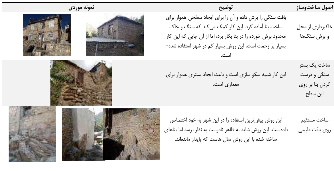
جدول ۴. اصول بسترسازی در شهر پاه

۱. پی‌سازی و کرسی‌چینی: از سنگ برای پی‌سازی و کرسی‌چینی استفاده شده است که در جدول ۵، به اصول ساخت‌وساز آن پرداخته می‌شود.