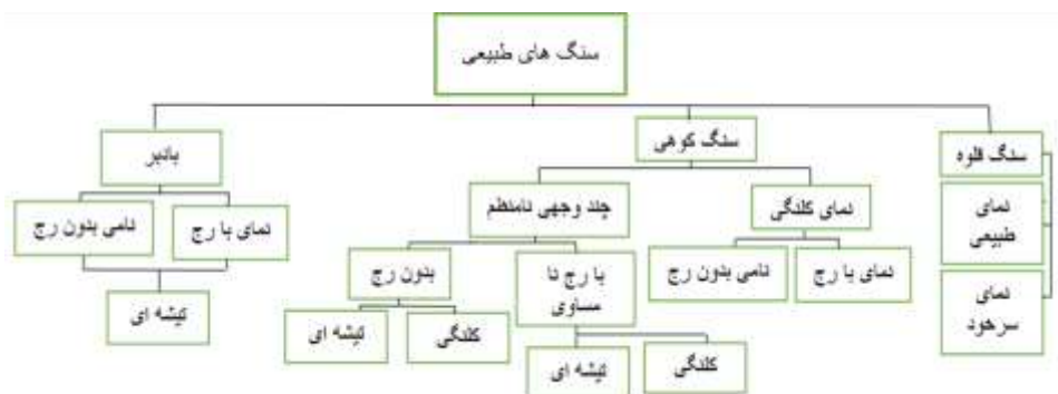
شکل ۵. سنگ‌های طبیعی مورد استفاده در خانه‌های شهر پاوه

سنگ به‌عنوان اصلی‌ترین مصالح بوم‌آورد منطقه، نقش اول را در احداث خانه‌های پلکانی پاوه دارد. سنگ به دلیل در دسترس بودن و از همه مهم‌تر تطابق با اقلیم به شدت مورد توجه است به‌طوری‌که از همان سنگ تراشیده شده جهت ساخت ابنیه استفاده می‌گردد. نمای خانه‌ها معمولاً ساده بوده که با رعایت سنگ‌چینی