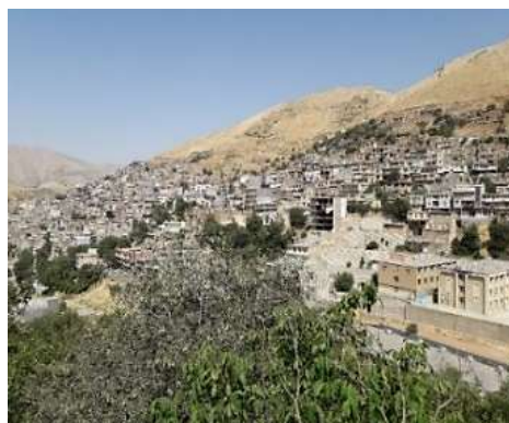
شکل ۴. نمونه بافت پلکانی و خانه‌های شهر پاوه

منظم، بندهای بین سنگ‌ها دارای نمایی زیبا هستند (شکل ۵). برای ساخت بام از دومین مصالح بوم‌آورد منطقه، یعنی چوب استفاده شده که این چوب‌ها به صورت دیمک، مروله، دزه‌ون، باله‌شم برای کارکردهای مختلفی در معماری پاوه (منطقه هورامانات) استفاده شده‌اند. چوب، در ساخت درها، پنجره‌ها و نعل‌درگاه‌ها نیز بکار رفته است.