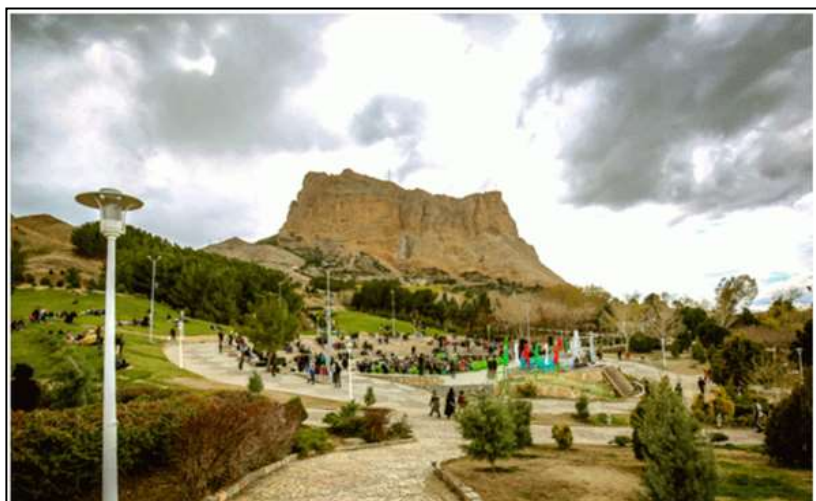
شکل ۲. کوه و پارک صفه در اصفهان

نیز معروف است و به‌عنوان هسته مرکزی پارک کوهستانی صفه است و چشمه‌های موجود از جمله چشمه پاچنار و خاجیک به‌عنوان قلب تپنده این مجموعه‌اند که با وجود درختان کهنسال همچون نگینی زیبا می‌درخشد (شکل ۲).