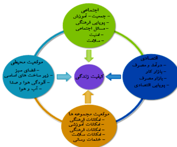
شکل ۱. نمودار شاخص‌ها و متغیرهای سنجش کیفیت زندگی شهری

محققان حوزه کیفیت زندگی معتقدند که شاخص‌های ذهنی، قدرت تبیین بیشتری دارد، در حالی که شاخص‌هایی که بصورت عینی شرایط زندگی را می‌سنجند، فقط می‌توانند حدود ۱۵ درصد از کیفیت زندگی فرد را تبیین کنند (Ghafari et al, 2009: 4).