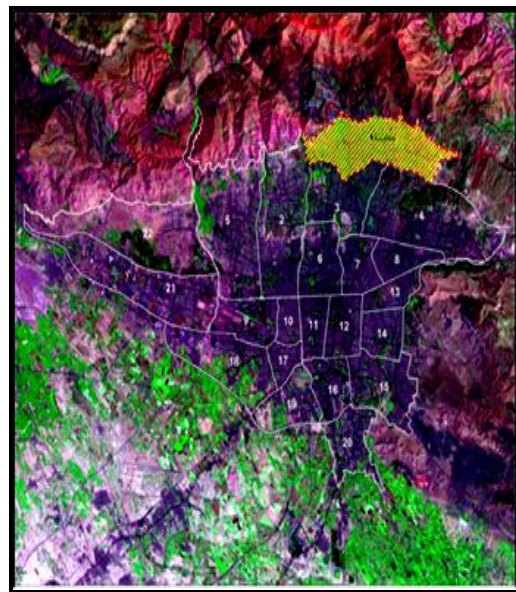
شکل ۱. سازمان فضایی تهران و منطقه یک

همچنین در حالی که از سال ۱۳۵۵ تا سال ۱۳۶۵ تنها ۱۳ نهاد زنان در ایران وجود داشت، تا سال ۱۳۷۹ این تعداد به ۱۵۸ سازمان ثبت شده و ۹۲ سازمان ثبت نشده رسید. در سال ۱۳۸۴ این تعداد سازمان‌ها به ۵۶۹ سازمان ثبت شده و ۵۲۴ ثبت نشده رسیده‌اند. این نهادها در سال ۱۳۸۵ به ۵۸۳ ثبت شده و ۵۷۱ ثبت نشده افزایش یافت (www.moi.ir: 22). اهمیت این نهادها تا به آن حد است که شهرداران این شهرها به هنگام تدوین برخی برنامه‌ها، امور اجرایی و یا افتتاح پروژه‌های شهری در سطح محلات، از آن‌ها به همکاری و یا حضور، دعوت به‌عمل می‌آورند، محله‌های منطقه یک شهر تهران نیز از این مقوله جدا نیستند و حامل این نهادهای فعال و خودجوش در سطح محله‌های مختلف می‌باشند.