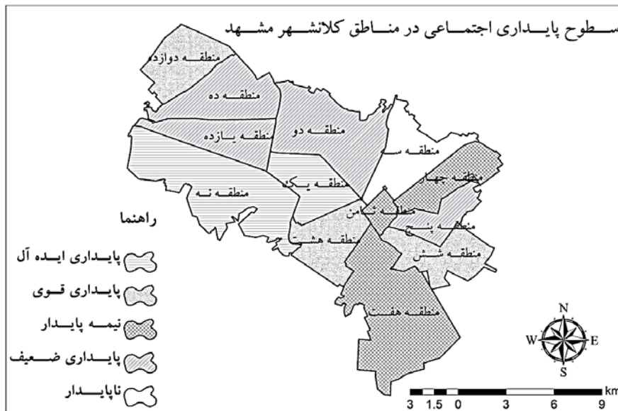
شکل ۳. نقشه‌های سطح بندی مناطق کلان‌شهر مشهد براساس شاخص‌های پایداری اجتماعی و پایداری کلی

مأخذ: ابراهیم‌زاده و همکاران، ۱۳۸۸؛ قربانی و عظیمی، ۱۳۹۳