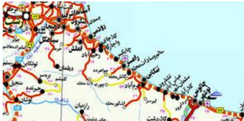
شکل ۲: نقشه موقعیت شهر چابکسر در نقشه استان گیلان

شهر چابکسر در جنوب غربی دریای خزر و شرقی‌ترین نقطه استان گیلان و نیز در ناحیه شرقی شهرستان رودسر واقع شده و از نظر موقعیت جغرافیایی در ۵۰ درجه و ۳۲ دقیقه طول شرقی و ۳۶ درجه و ۸۹ دقیقه عرض شمالی جغرافیایی قرار دارد (شکل ۲). از نظر توپوگرافی در شرایط ساحلی و جلگه‌ای و کوهپایه‌ای قرار دارد، همچنین ارتفاعات محدودیت عمده‌ای برای توسعه شهر محسوب می‌شود. دارای آب و هوای منطقه معتدل و میانگین بارندگی سالیانه منطقه ۱۴۳۸/۲ میلی‌متر می‌باشد.