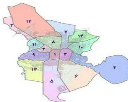
شکل ۲. نقشه مناطق پانزده‌گانه شهر اصفهان

طبق منطقه‌بندی شهرداری اصفهان از سال ۱۳۹۲، شهر به ۱۴ منطقه تقسیم شده است (شکل ۲).