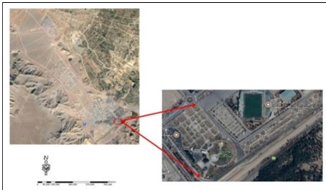
شکل ۱. موقعیت بوستان خلیج فارس در شهرستان فولادشهر