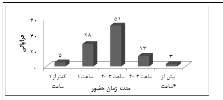
شکل ۲. مدت زمان حضور افراد در بوستان مورد مطالعه

بر اساس بررسی مدت زمان اقامت افراد در بوستان مورد مطالعه