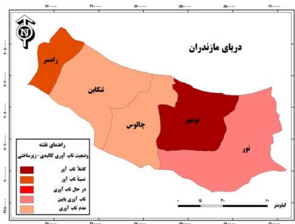
شکل ۲. نقشه شهرهای ساحلی غرب استان مازندران براساس وضعیت تاب‌آوری کالبدی-زیرساختی

مقایسه شهرهای ساحلی غرب استان مازندران بر اساس وضعیت بازآفرینی شهری با استفاده از تکنیک ایداس در این بخش از تحقیق شهرهای ساحلی غرب استان مازندران بر اساس وضعیت بازآفرینی شهری با استفاده از تکنیک ایداس با یکدیگر مقایسه شده و رتبه‌بندی می‌شوند. تعیین وزن و اهمیت ابعاد سه گانه بازآفرینی شهری با استفاده از روش کریتیک نشان می‌دهد از میان ابعاد مختلف بازآفرینی، بعد اقتصادی در شهرهای نمونه با امتیاز نسبی (۰/۳۷)، از ارزش و اهمیت بالاتری برخوردار است (جدول ۸).