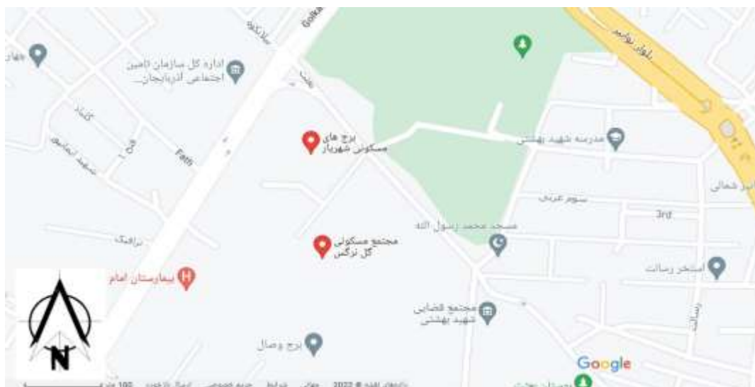
شکل ۳. نقشه موقعیت جغرافیایی مجتمع گل نرگس تبریز

مجتمع مسکونی ۳۰۰ واحدی گل نرگس تبریز در بلوار استاد شهریار، خیابان گلکار، خیابان بعثت واقع شده است. شامل ۳ برج به نام‌های عارف، مبین و شهریار می‌باشد. برج‌های عارف و مبین هر کدام ۱۶ طبقه و برج شهریار در ۲۰ طبقه احداث گردیده‌اند. هر طبقه برج‌ها شامل ۶ واحد مسکونی می‌باشد که در سه متراژ ۱۲۸، ۱۱۰ و ۱۰۵ متری ساخته شده‌اند. هر برج دارای ۳ طبقه پارکینگ در زیر زمین می‌باشد.