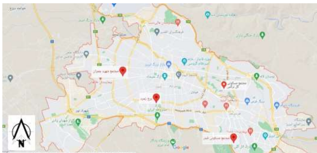
شکل ۲. موقعیت مجتمع های مورد بررسی در شهر تبریز

در این مطالعه محدوده مورد بررسی شامل ۴ مجتمع مسکونی گل نرگس، برج زمرد، شهید چمران، فجر شاه (اثل) گلی، بوده است (شکل ۲).