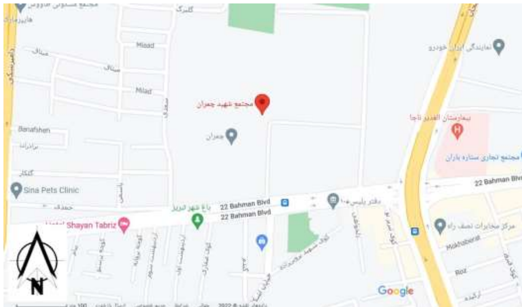
شکل ۵. نقشه موقعیت جغرافیایی مجتمع مسکونی چمران

مجتمع مسکونی «دکتر چمران تبریز» با مساحت حدودا ۷ هکتار واقع در منطقه ۴ تبریز دارای ۱۰ بلوک و ۳۰۰ خانوار می باشد. مجتمع مسکونی نام برده در سال ۱۳۶۲ ساخته و به بهره برداری رسیده است، با توجه به موقعیت استراتژیک این مجتمع از لحاظ نزدیک بودن به مراکز خرید متعدد، مراکز درمانی و سایت وسیع آن نقش مؤثری در حفظ و احیای کالبد شهر دارد.