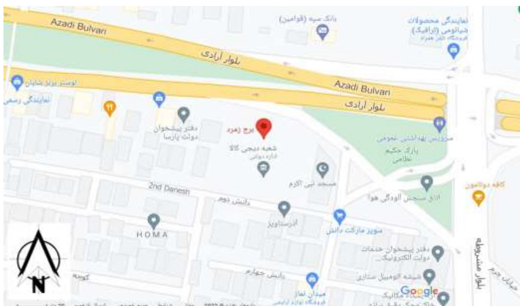
شکل ۴. نقشه موقعیت جغرافیایی مجموعه مسکونی برج زمرد تبریز

برج‌های مسکونی دوقلوی زمرد در خیابان آزادی، میدان حکیم نظامی تبریز واقع شده‌اند. این برج در مجموع شامل ۳۰۰ واحد مسکونی در ۱۵ طبقه می‌باشند. تعداد واحدها در هر طبقه شامل ۱۰ واحد مسکونی می‌باشد. پارکینگ‌ها در طبقه همکف و دو طبقه زیر زمین قرار گرفته‌اند.