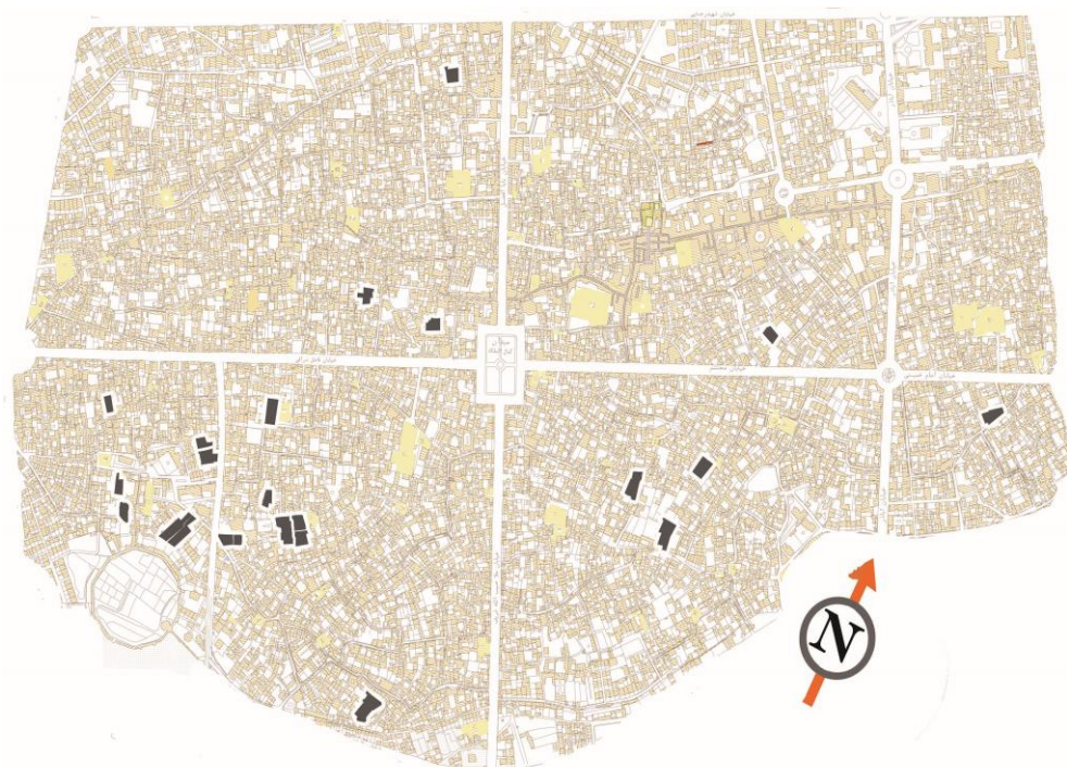
شکل ۲. موقعیت قرار گیری نمونه‌ها در بافت قدیم شهر کاشان