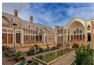
خانه منوچهری: خیابان محتشم کاشانی، محله میر نشانه. ساخت: اوایل قاجار