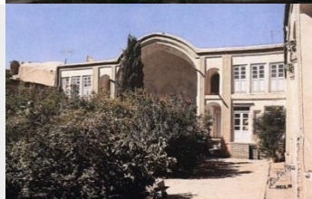
خانه دستمالچی: خیابان محتشم، محله درب یلان ساخت: آخر قاجار