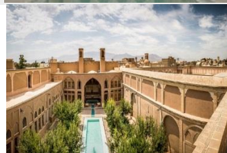
خانه یوسفی: خیابان علوی، محله کوشک صفی. ساخت: اوایل قاجار