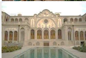
خانه‌های شمیمان: خیابان فاضل نراقی، محله گریچه. ساخت: اواسط قاجار