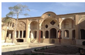
خانه حسینی: خیابان علوی، کوچه خانزاد، محله کوشک صفی. ساخت: اوایل قاجار